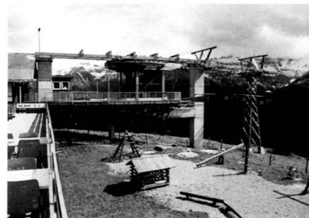
Gondelbahn in Braunwald: Erholungszonen sind für eindimensionale Freizeit Zwecke möbliert worden. Der Gesamterholungswert dieser Landschaften nimmt damit ab.

Town and country planning has also hardly been able to influence the advance of the city into landscapes which have been declared to be leisure areas. The statutory obligation to stipulate recreational areas in planning and then integrate them into the plan has failed all too often up to now. Many classical tourist resorts do not possess a completely updated utilisation plan. A reciprocal build up between traffic facilities, accommodation structure and leisure facilities is still to be observed. However, recreational planning is a typical cross-section task which must not be content with just designating skiing sport zones and intensive recreational areas. Already