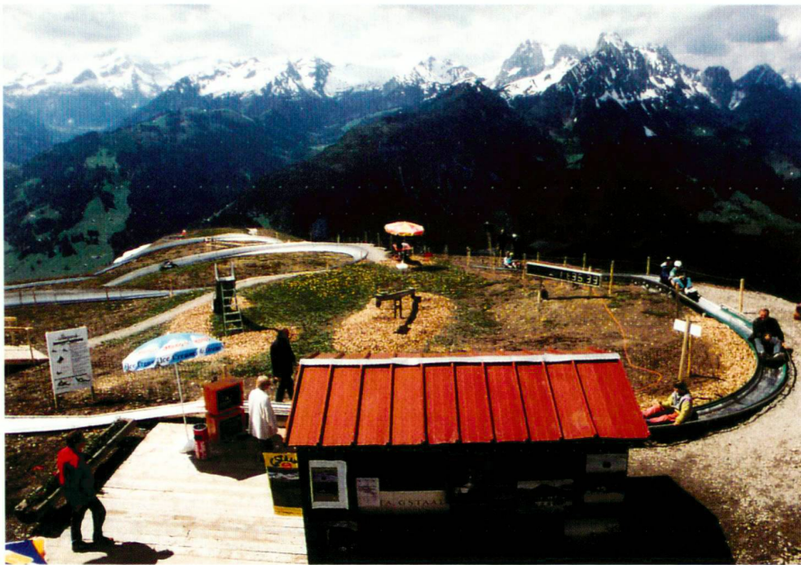
Oben: Sommerrodelbahn Rellerli: Die Kulturlandschaft wird als Vergnügungspark missbraucht.