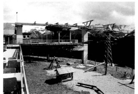
Gondelbahn in Braunwald: Erholungszonen sind für eindimensionale Freizeit Zwecke möbliert worden. Der Gesamterholungswert dieser Landschaften nimmt damit ab.

Town and country planning has also hardly been able to influence the advance of the city into landscapes which have been declared to be leisure areas. The statutory obligation to stipulate recreational areas in planning and then integrate them into the plan has failed all too often up to now. Many classical tourist resorts do not possess a completely updated utilisation plan. A reciprocal build up between traffic facilities, accommodation structure and leisure facilities is still to be observed. However, recreational planning is a typical cross-section task which must not be content with just designating skiing sport zones and intensive recreational areas. Already