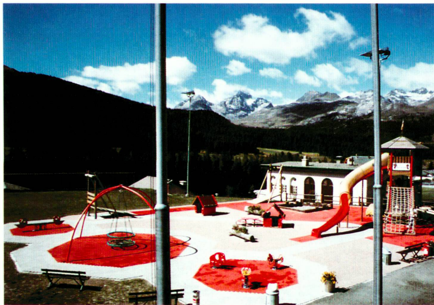
Below: Pontresina: The alienation from the natural environment begins already with the sterility of pre-fabricated leisure facilities.