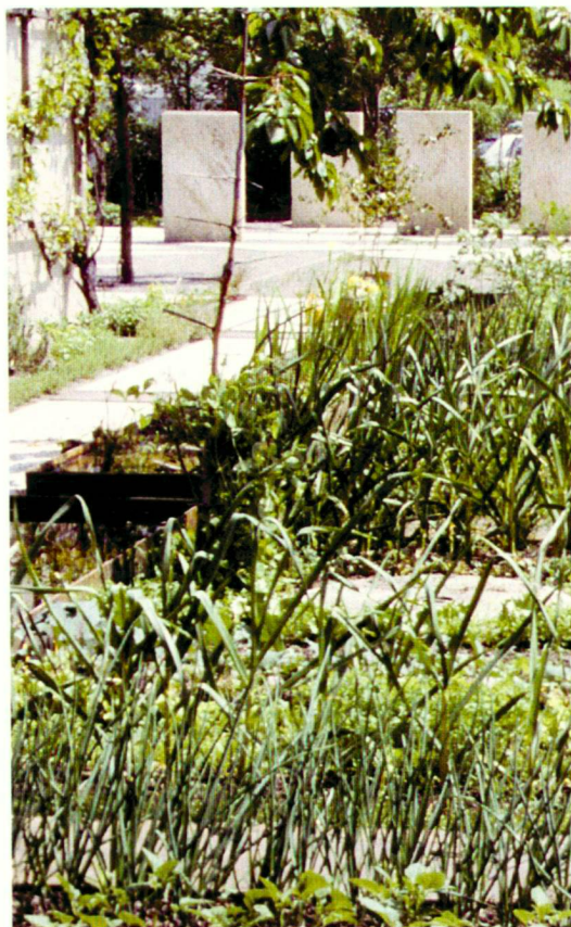
Ein ganz traditioneller Gemüse- und Küchen-garten.

nehmen? Einer der Streifen mit unsortiertem Wandkies blieb trockenheitsliebenden Gräsern, begleitet von gelb und blau blühenden Kräutern, vorbehalten. Dass, unvorhergesehen, auch Hauhechel ( Ononis spinosa ) aufkam, macht nichts. Sie mag ich auch. Ein Band mit Gartenerde ist heute von einem Teppich aus Thymian überzogen, überlagert mit Doldenblütlern: Hirschwurz ( Peucedanum cervaria ) und Hirschheil ( Seseli libanotis ), in geschützter Lage auch Thapsia villosa und Ferula communis . Bereits in diesem Frühling und Herbst setzten etwa fünfzig Arten von Zwiebelpflanzen leuchtende Akzente.