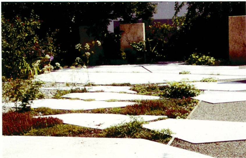
Thymian und Doldenblütler flankiert vom unbewachsenen Kiesstreifen.