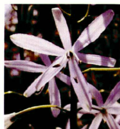
Tulipa saxatilis Anemone coronaria Iris graminea Anthericum liliago

Spannend gestaltete sich die Bepflanzung des Sandstreifens. Ich suchte verschiedene Ruderalstandorte nach einjährigen Arten ab. Mein Mann steuerte Samen salztoleranter Pflanzen der sauren Böden Norddeutschlands bei. Zu unserer Überraschung gedieh einfach alles. Unter Umständen müssen auch wissenschaftliche Erkenntnisse ignoriert werden!