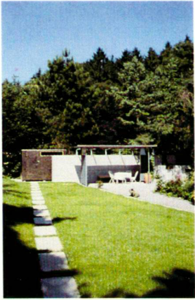
Die «Black Box» am Waldrand.

Das Wohnzimmer öffnet sich durch das grosse Fenster zum weiten Garten. Der hausnahe Betonplattenbelag bringt das Wohnen jetzt nach draussen. Der Sitzplatz liegt vertieft und ist intim. Geländestufen, mit Buchs vorgepflanzt, führen zum erweiterten und noch verborgenen Gartenraum. Seitlich stehen neu zwei verschoebene, gestufte Betonmauern. Sie geben Geborgenheit und etwas Schutz vor Wind und Strassenlärm. Davor steht die alte Föhre, von gelb blühenden Waldreben und grünem Efeu überwuchert. Die Schrittplatten führen durch die rot und weiss blühenden Stauden und die grün abgestufte Blattvegetation zum Pavillon. Die leichte Holz-, Glas- und Stahlkonstruktion ist von Hopfen umrankt. Von hier kann der Blick über das Staudenbeet schweifen. Die Stauden wachsen dort kontrolliert, gefasst von einem Band aus Metall. Das Blumenbild spielt mit den Farben Rot, Gelb und Blau, punktiert mit Grün und Grau. Die lange, leicht gebogene Beetform weist auf den alten Birnbaum in Nachbars Garten.