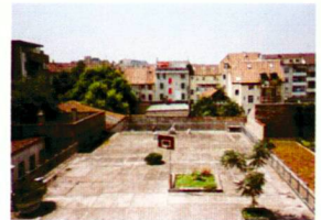
Auf diesem Dach entsteht ein ökologisch wertvoller Naturgarten – offen für die Bewohner.

Für Informationen zur Teilnahme an der Aktion «Das bessere Flachdach» wenden Sie sich bitte an den Gewerbeverband Basel-Stadt, Elisabethenstrasse 23, 4010 Basel, Telefon 061-271 02 88, Fax 061-272 62 25.