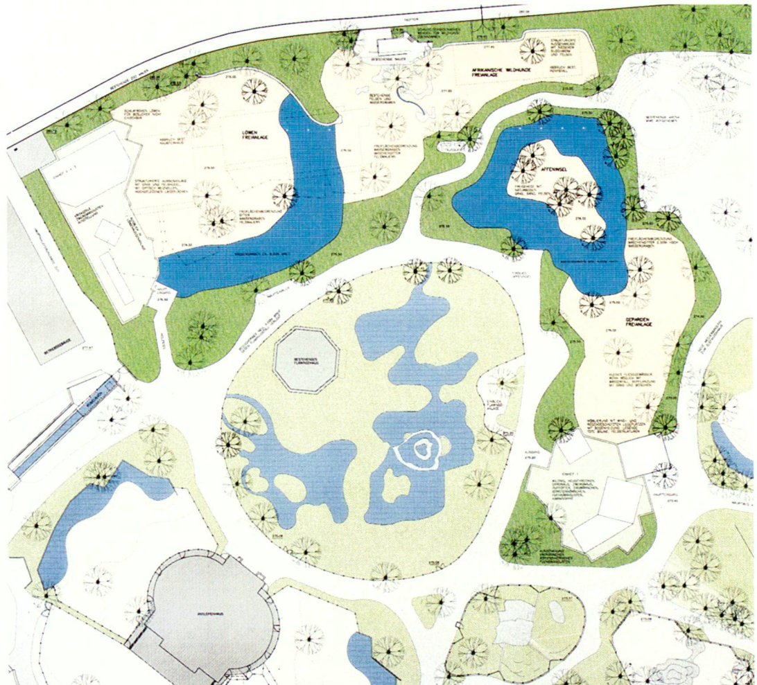
Planausschnitt mit neuer Beutegreiferanlage (oben) und Flamingoanlage (mitte).