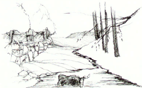
Einige - Einbebauung und Gruppen mit - Beton und Holz, ein grosser (Dachstuhl) - Die im Landschaftsraum - Baum aufstehen

Es gilt, das vorhandene Potential dieser Tallandschaft zu nutzen und die Eigenschaften der bestehenden Örtlichkeit mit den Konzeptabsichten des Wildparks zu verbinden. So steht nicht mehr das Zurschaustellen der Tiere im Vordergrund, sondern die Hügel- und Hanglage, Geländeabsätze, Vegetationsbestände usw., aus