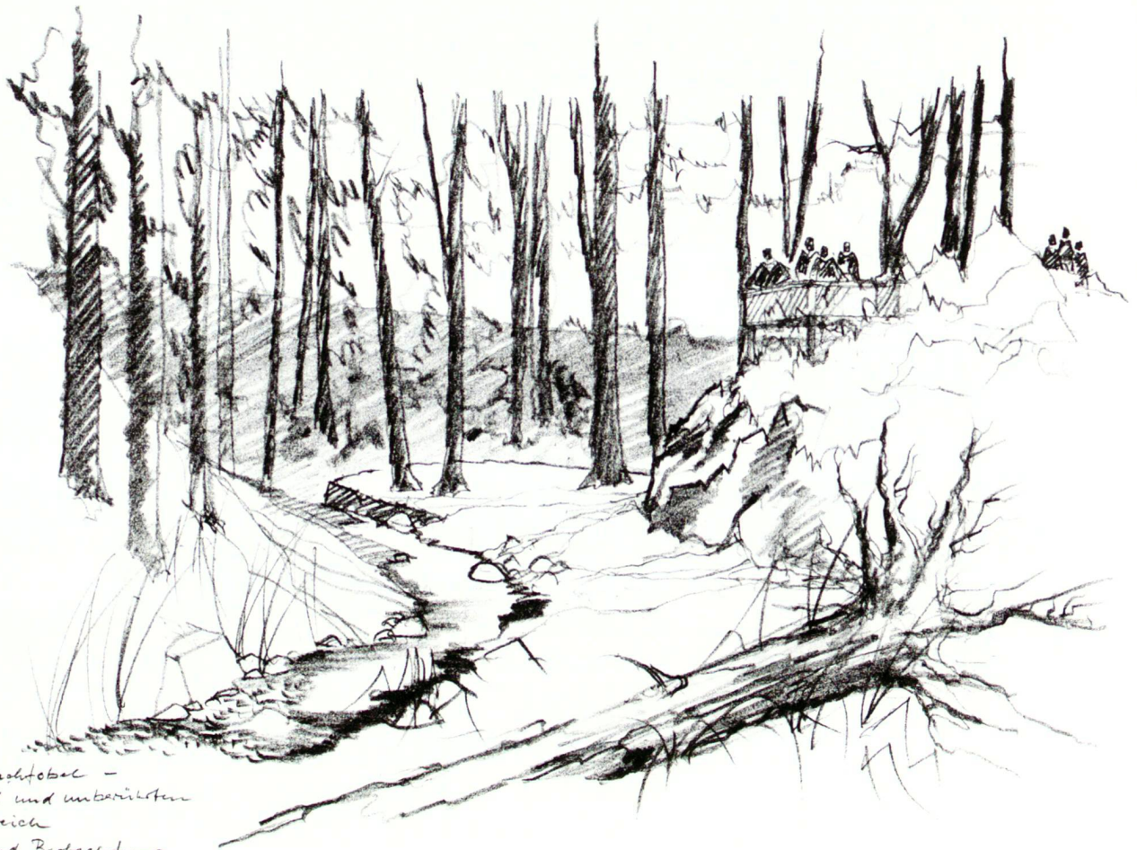
Gartenbachobel - für Wild und unberührten Naturbereich - Pfad und Beobachtung von der Hangkante - Sicht ohne Gitter (Wildlag)

Die Talsohle kann sich in einen Raum mit Urwaldcharakter entwickeln. Der Einblick in diese Dynamik ist künftig von der Hangkante aus möglich.