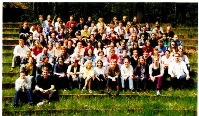
Rencontre de l'ELASA à Vierhouten