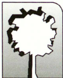
CENTRE DE LULLIER Section Architecture du Paysage