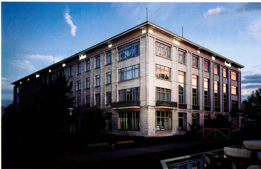
Joseph Kosuth: «Lokalisierte Welt, Singen/ Located World, Singen» «le monde localisé, Singen»

Les passants ne se meuvent plus dans le ventre du tunnel avec la même sensation de vide que d'habitude. Ils se meuvent dans du bleu. Un bleu qui semble ne mener à rien. Ce qui est quotidiennement subliminal prend de l'importance, devient clair. Le souterrain, les bruits étouffés, le béton humide, tout est intégré dans un sentiment de profondeur, aquatique, de distance vis-à-vis des activités à la