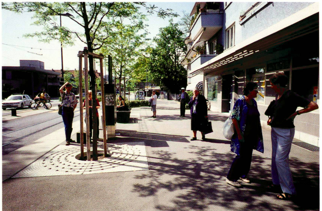
Attraktive Seitenbereiche bei den Tramhaltestellen.

Trafic motorisé: Malgré la suppression d'une voie séparée de tram (réduction de 4 à 2 voies) il a résulté une légère augmentation de trafic de 5