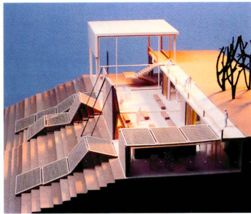
Gestaltung der Grubenkante, Siegerentwurf im Auftaktwettbewerb Großräschen

In Großräschen, dem ehemaligen Sitz der Ilse-Bergbau-Aktiengesellschaft (I.B.A.) und jetzigem Sitz der Geschäftsstelle der Internationalen Bauausstellung (IBA), befindet sich das Zentrum des Gebietes mit Informationsmöglichkeiten auf den IBA-Terrassen, mit der durch seine Architektur ein ganzes Jahrhundert Bergbaugeschichte widerspiegelnden IBA-Allee, einer mit Findlingen künstlerisch gestalteten Allee der Steine, dem Ilse-Park zwischen Großräschen, Senftenberg und dem Lausitzring sowie einem Unter-Wasser-Erlebnis.