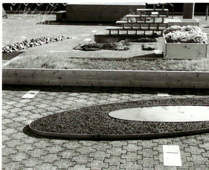
Studentische Projekte an der Professur für Landschaftsarchitektur, ETH Zürich