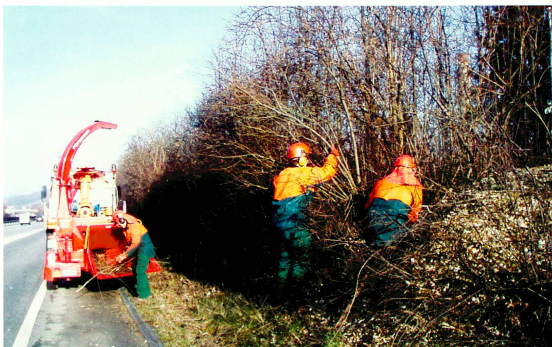
Pflegeequipe beim Gehölzschnitt

La planification des délais est un outil central de la gestion des espaces verts. À l'aide de la planification des délais, les moyens nécessaires à l'exploita-