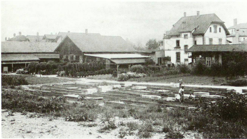
Alte Stadtgärtnerei an der Effingerstrasse, 1942

Les anciens bâtiments du Service à l'Effingerstrasse, 1942