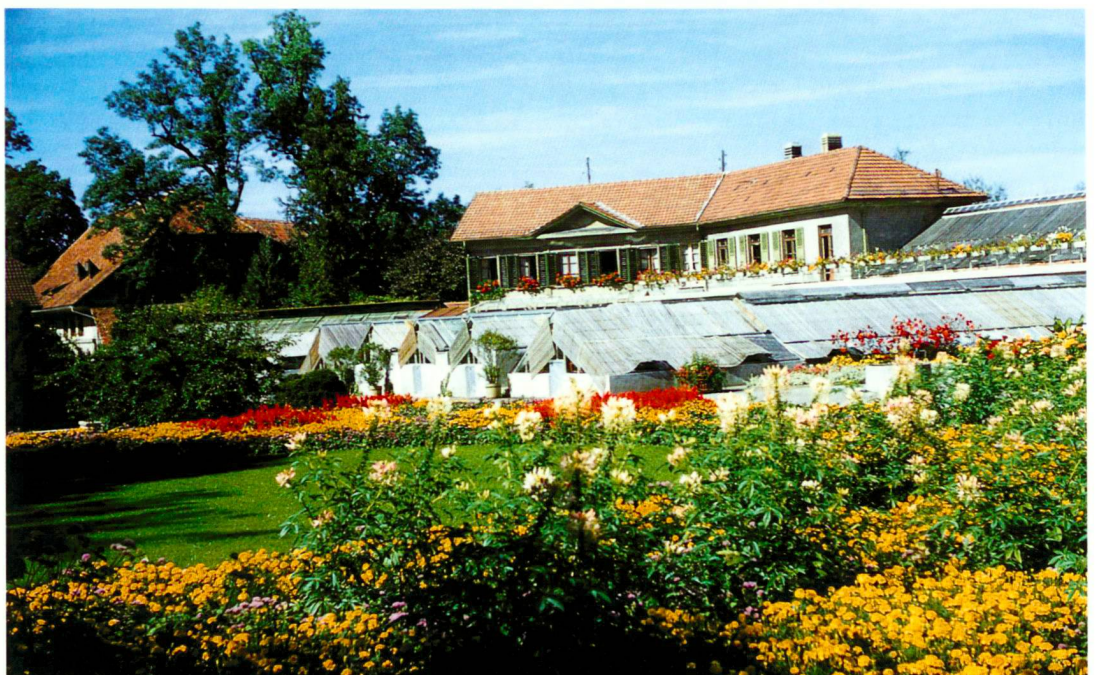
Alter Betrieb in der Elfenu mit Gewächshäusern, 1953

La reprise en 1991 de trois cimetières bernois – du cimetière de Schosshalde (qui existera d'ailleurs depuis 125 ans en 2003), du cimetière de Bremgarten et Bümpliz – constitue un autre jalon de l'his-