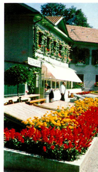
Alte Stadtgärtnerei, Effingerstrasse

Un objectif essentiel à l'avenir nous semble résider dans un niveau d'information accru à l'in- térieur du Service et avec le public. Les prestations du Service des parcs et promenades ont pour but de satisfaire ses clients. Le Service veut informer le public de manière plus active sur son travail. Il est nécessaire à l'avenir de mettre le public au cou- rant du travail fourni par le Service des parcs et promenades pour qu'il puisse aussi estimer ses prestations. Les collaborateurs ont des raisons légi- times d'être fiers de travailler dans une entreprise moderne de prestations de service.