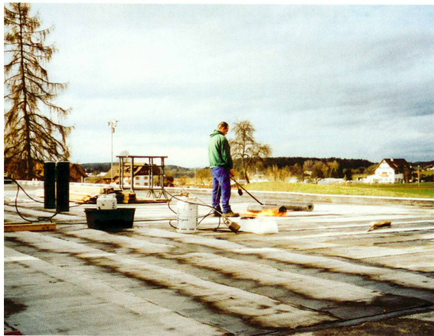
Flachdach im Einbau. Leichtes Gefälle zur Ableitung überflüssigen Wassers.