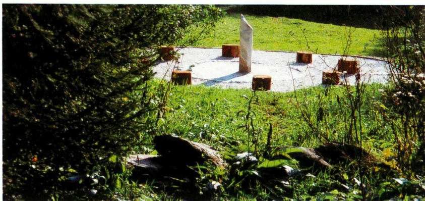
«Meditation point», Veronik Menanteau, 2001