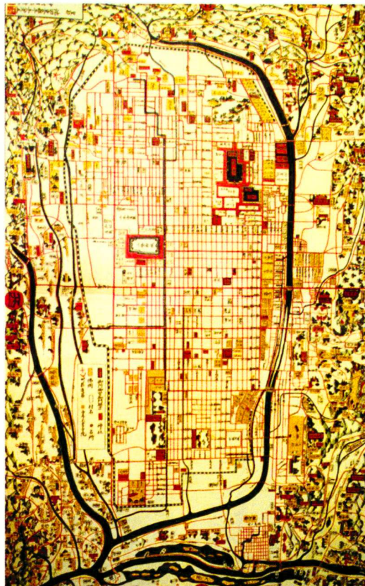
Karte von Kyoto, Ikeda Toritei, 1835

D er Fluss Kamo spielt eine bestimmende Rolle im Bild der japanischen Stadt Kyoto. Er gehört zu den Charakteristika dieser Stadt als städtebauliches und landschaftliches Element. Steht man auf einer der zahlreichen Brücken des Kamo, der Blick dem Flusslauf folgend, die Silhouette der Berge im Hintergrund, kann man nachvollziehen, warum der Historiker Rai Sanyo