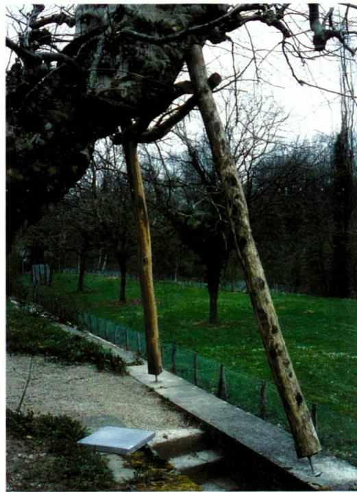
Sicherung eines gefährdeten Baumes in einer Platanenallee der 1830er Jahre (Kloster Wettingen, 1995).

• Und schliesslich geht es nicht darum, verlorene Teile eines Gartendenkmals durch zeitgenössische Schöpfungen zu ersetzen oder gar verbliebene Denkmalspuren abzuwerten, um sie dann zerstören und ein solches «Gestaltungserwartungsland» erst schaffen zu können. – Ist im Einzelfall eine grössere Ergänzung notwendig und eine zeitgenössische Lösung der richtige Weg dafür, dann ist die Landschaftsarchitektur, nicht die Denkmalpflege gefordert. Aufgabe der Denkmalpflege ist es in einem solchen Fall aber, klare Rahmenbedingungen für den materiellen und optischen Schutz des Denkmals oder der Denkmalreste zu formulieren.