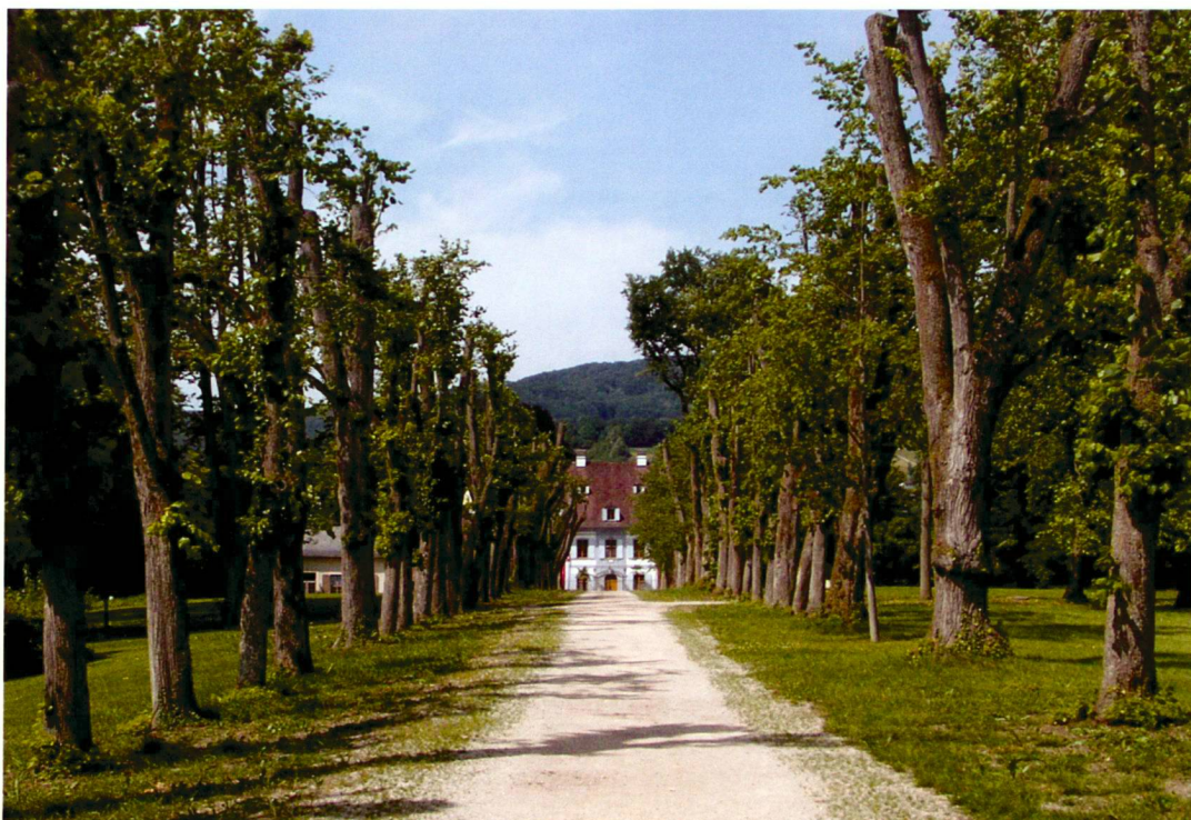
Barocke Lindenallee vor der Kappung, 2003 (links) und nach der Kappung, 2004 (rechts).

Toutes les autres interventions effectuées depuis 2002 visent à conserver la substance et à faire ressentir de nouveau les atmosphères particulières des différents espaces paysagers ainsi que les relations entre elles.