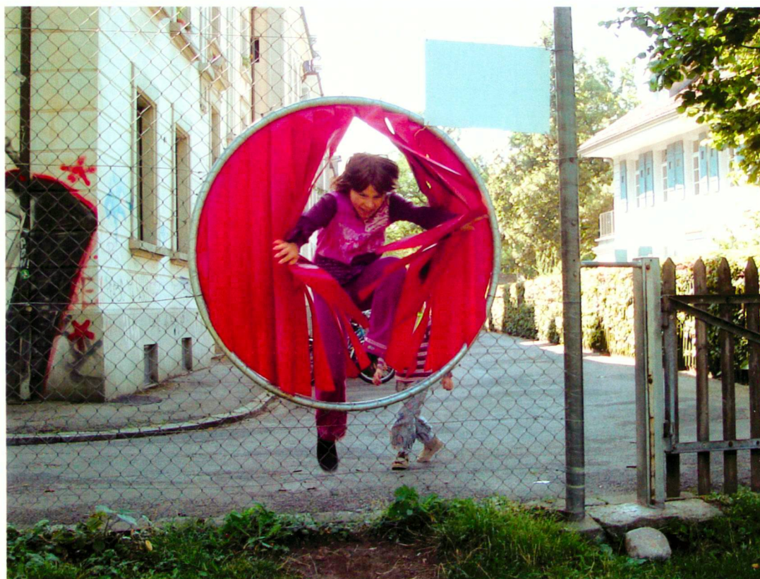
Stadtgärtnerei Bern (7)

«Mille de jeu» dans le quartier de la Lorraine: passage serré.