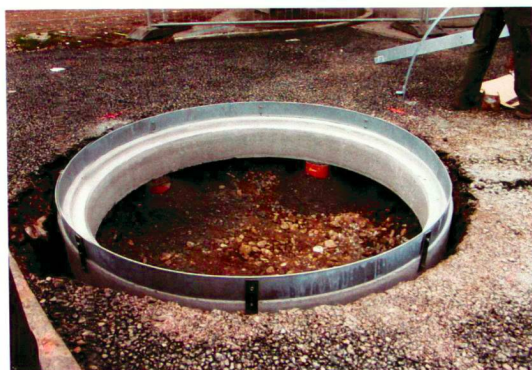
Gillig et associées (3)

vorherige Analyse des Bodens in der Baumschule ist erforderlich, um die Kompatibilität mit den vorgesehenen Mischungen und die Wahl der Pflanzerden zu ermöglichen.