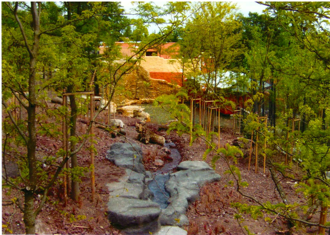
Walter Vetsch (6)

Extrait de la simulation de savane arboré, marquée par des végétaux au fin feuillage contrastant avec les arbustes à grandes feuilles, des graminées sèches et de la terre brûlée (lave).