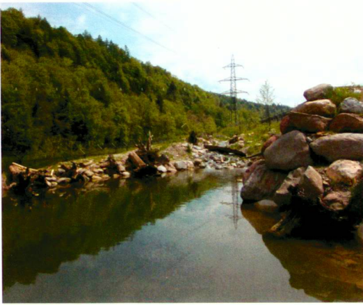
AG für Landschaft (2)

sen Bachabschnitt in guter Blickdistanz zum Publikumsstandort anzulegen. So können die Besucher die Arbeit, vorzugsweise in der Abenddämmerung, sehr gut beobachten. Sobald die Tiere den Damm gebaut und damit das Rauschen gestoppt haben, entsteht dahinter ein zweiter Teich im Überflutungsbereich des Baches. In diesem seichten Gewässer können die Biber sich dann in aller Ruhe ihrer Lieblingspeise widmen und den dort angelegten Weidenrasen vertilgen.