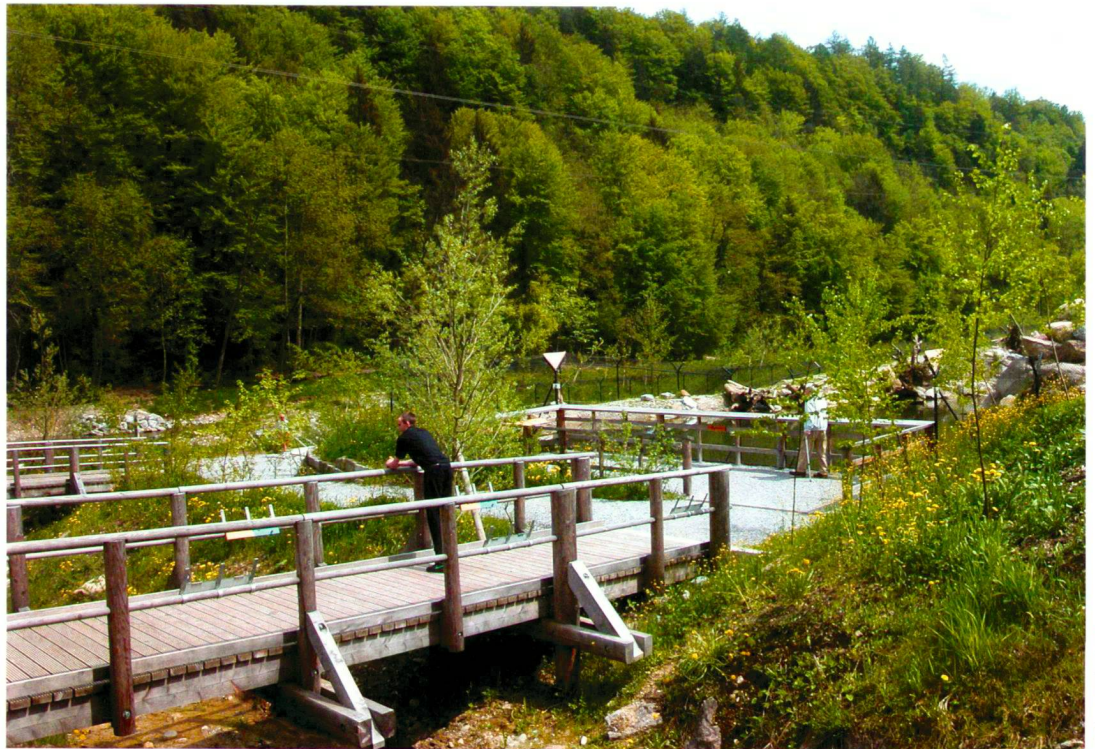
AG für Landschaft

An den Ufern der oft ungestümen Sihl gewähren Biber und Fischotter in naturnaher Anlage intime Einblicke in ihr Leben am Fluss.