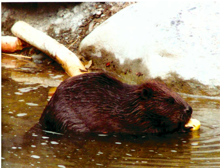
Grün Stadt Zürich (2)

Le constructeur de digues en train de prendre «les quatre heures» (à gauche), le pêcheur dans sa nouvelle maison (à droite).