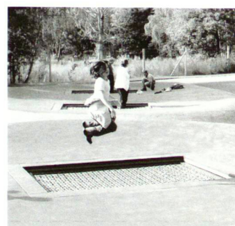
Trampoline oder andere «dynamische Einzelspielgeräte» ziehen Kinder besonders an.

Kinder, Jugendliche und Erwachsene benötigen Bewegung. Entsprechend ihrer Entwicklungsphase sollten die Kinder passende Spielangebote vorfinden. Hinnen Spielplatzgeräte unterscheiden im Wesentlichen zwischen starren und dynamischen Spielgeräten. Starre Geräte werden meist als Klettergerät