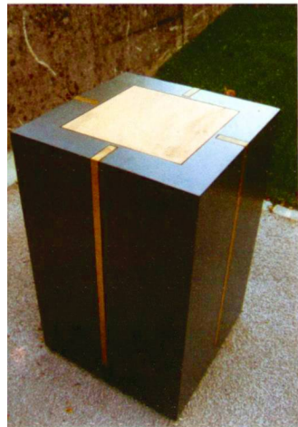
Fahrni und Breitenfeld (5)

Tombe commune à Nunningen: situation à l'intérieur du cimetière et dispersion des cendres au-dessus de la tombe.