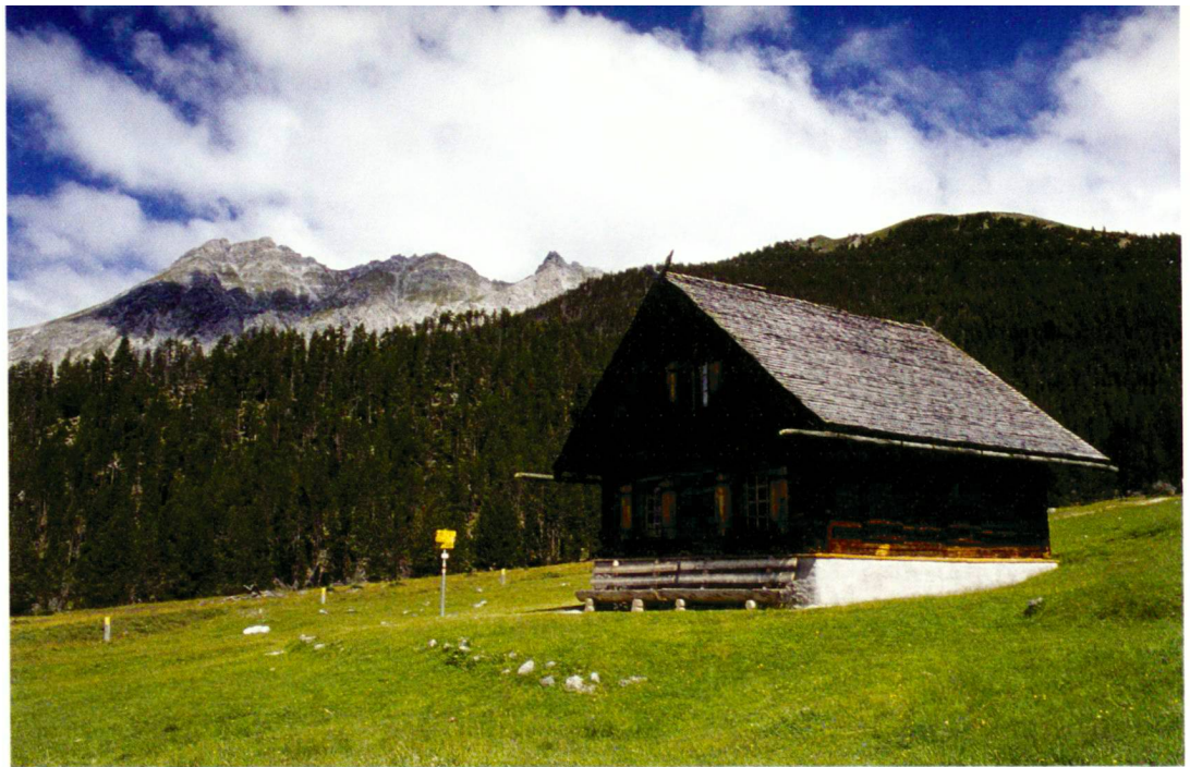
Dieter Spinner (6)