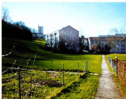
Michèle Novak (2)

Le paysage d'agglomération en tant qu'espace interstitiel aménagé de manière minimaliste. Un petit décalage de l'angle de prise de vue crée deux images différentes de l'espace.