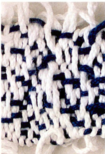
Sandra Simic (Ausschnitt)

Regard sur la rue de quartier et le jardin privé. L'image, séparée en deux par le choix du motif, montre deux vues différentes et des nettetés contrastées.