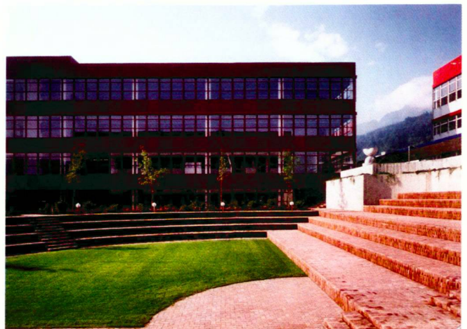
Ege Industriewerbung, 1977

Der abgetreppte Innenhof des Zentralschweizerischen Technikums in Horw mit einheitlichem Verbundstein ist farblich abgestimmt auf das Gebäude von Peter Stutz.