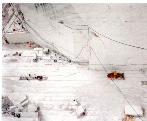
Edward Burtynsky: «Rock of Ages # 15», Active Section, E.L. Smith Quarry, Barre, Vermont, 1992 (picture on the left) «Carrara Marble Quarries # 24», Carrara, Italy, 1993 (picture on the right).