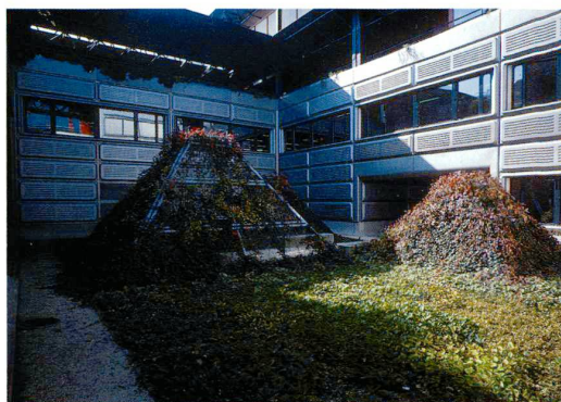
6  Ende 80er Jahre

4–7 Der Umgebungsplan der Ecole Polytechnique Fédérale de Lausanne (EPFL) von Schmocker-Willi um 1985 zeigt landschaftliche Strukturen, die mit linearen Baumreihen sowie Baumrastern bei den Parkplätzen durchsetzt sind; die Innenhöfe (violett) treten als kleine «Fremdkörper» hervor. Der gelbe Dachgarten und der Pyramiden-Hof weisen auf ganz unterschiedliche Weise auf die künstliche Umgebung hin.