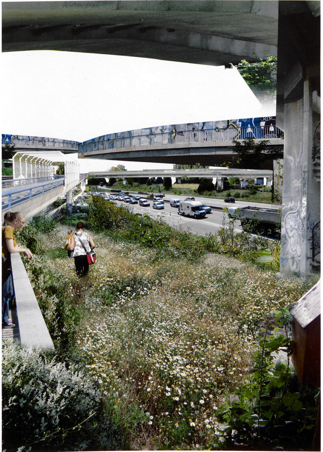
1 Fotomontage: Natur am Strassenrand. Photomontage: La nature au bord de la route.

Walter Simone (à partir des photographies de Grégoire Chelkoff et Magali Paris)