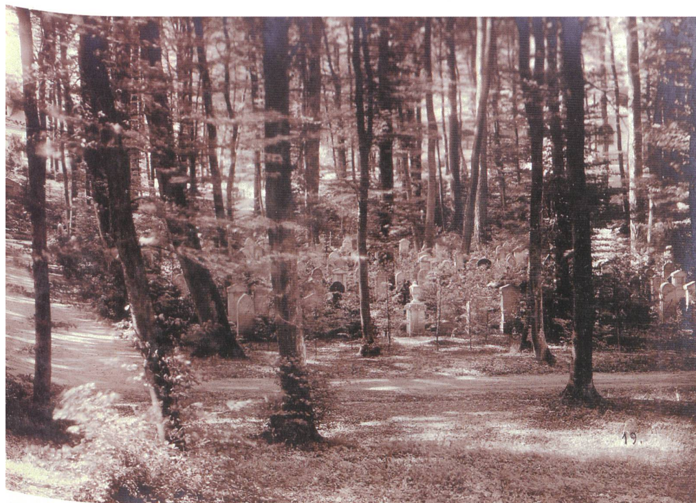
1 Grabfeld im Eingangsbereich, um 1945. Quartier dans le secteur de l'entrée, environ 1945. 2 Abdankungshalle, 2009. Bâtiment pour les cérémonies funèbres, 2009.

Pour tenir compte des différentes époques, l'étude historique comprend un rapport sur l'état global du site et décrit les caractéristiques des différentes parties: «Forêt et plantation de tombes», «types de tombes et tombeaux», «sculptures», «enclos», «constructions» et «équipements» constituent la composition perceptible et sont décrits dans