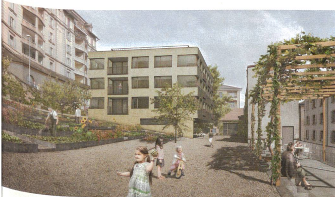
Binggeli architectes sia et ÉGÜ architectes-paysagistes

La ville de Neuchâtel et la Coopérative d'en face se sont réunies en tant que futurs maîtres d'ouvrages respectivement de l'espace public et de l'espace privé de la parcelle Vieux-Châtel. Les lauréats du concours, Binggeli architectes sia et ÉGÜ architectes-paysagistes proposent une disposition de l'ensemble qui donne de la place au parc public.