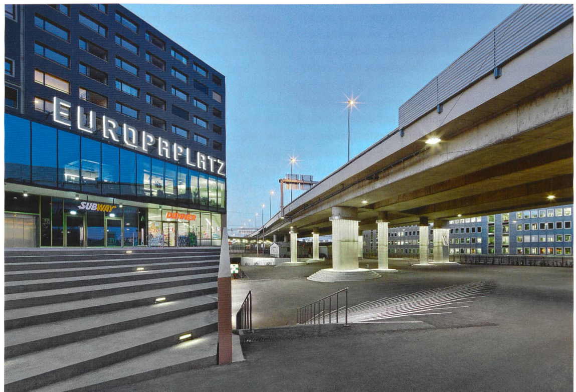
1 Blick Richtung Bahnhof Europaplatz. Vue vers la gare Europaplatz.

Ausserholligen se situe entre Berne et Bümpliz. L'ancienne route nationale vers Fribourg passe ici tout près, de même que la ligne ferroviaire depuis 1860. La construction du tronçon ferroviaire vers Neuchâtel d'où bifurque la voie dans la vallée de la Gürbe et vers Schwarzenburg (Gürbetal-Bern-Schwarzenburg GBS), date de 1901. Celui-ci passe sous le tronçon de Lausanne et la Freiburgstrasse. Dans les années 1970, l'autoroute A12 a franchi le tout avec un imposant pont autoroutier. Le classement en 1989 d'Ausserholligen comme pôle de développement cantonal a représenté l'impulsion décisive en faveur du développement urbain. Le résultat est la création des gares CFF et GBS