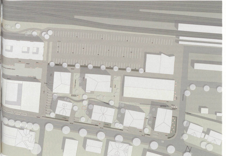
Camponovo Baumgartner Architekten, exträ Landschaftsarchitekten AG