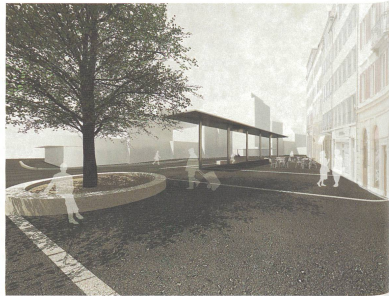
Evilquo Ferrera architecte

la place. L'ensemble est recouvert par une nouvelle toiture plate pouvant servir de scène pour des spectacles. (4) Une série de supports à vélos implantés de manière opportune dans l'espace résiduel à côté de la Coop, dont la façade ouest aveugle est proposée entièrement végétalisée.