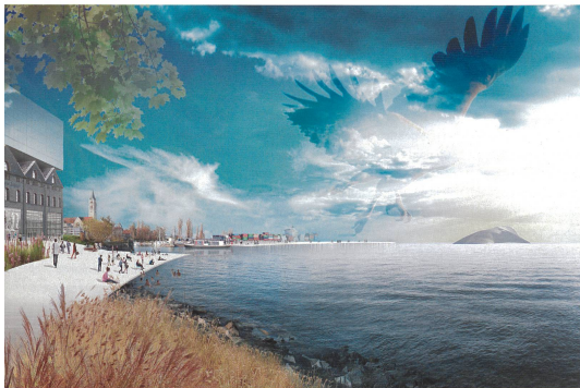
Hosoya Schaefer Architects, Plinio Bachmann, Studio Vulkan

Le projet élaboré sous la responsabilité d'Isabelle Evéquoze, architecte EPFL et Nuno Ferreira, architecte HES, résout avec peu de moyens la question posée. Les aménagements proposés pour la place du 1 er Août se résument en quatre points: (1) Un arbre unique, positionné sur la place, marquant habilement la rencontre des rues. (2) Une marquise longitudinale placée le long des quais dans l'alignement de la Grande-Rue, suffisamment détachée du front des façades au nord de la place pour ne pas en altérer l'élégante perspective. (3) Une transformation de l'édicule situé en est de la place: Sa fonctionnalité de kiosque et de WC public est conservée et il est complété d'une zone «salle d'attente» largement ouverte sur