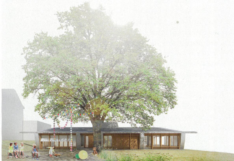
Beer + Merz Architekten

vorhandenen Strukturen. Die städtebauliche Bedeutung des historischen Schulhauses auf der Anhöhe wird durch die neuen Bauten nicht geschmälert, die Volumen gliedern sich trotz des erheblichen Raumbedarfs zurückhaltend in die Anlage und die Landschaft ein. Der eingeschossige Neubau des Kindergartens folgt mit seiner Ausrichtung der Turnhalle. Quer zum Geländeprofil definiert der flache Körper die Aussenbereiche der Gruppenräume und setzt die bestehende grosse Buche ins Zentrum dieser Flächen. Die Jury empfiehlt das Projekt für die Weiterbearbeitung und lobt insbesondere die stimmige Architektur des Kindergartens, der sich unter den schützenden Baum «wie unter ein riesiges Zelt» duckt.