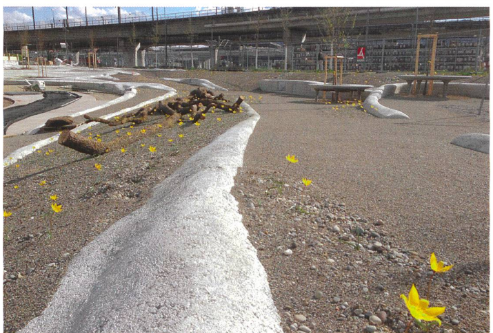
© antón & ghiggi landschaft architektur

Die Gestaltung des im Sommer 2015 in Zürich-West eröffneten Pflingstweidparks beruht auf dem Wettbewerbsprojekt von antón & ghiggi aus dem Jahr 2010. Das Büro machte auch die Ausführungsplanung für die Erstellung der Anlage von 2014 bis 2015.