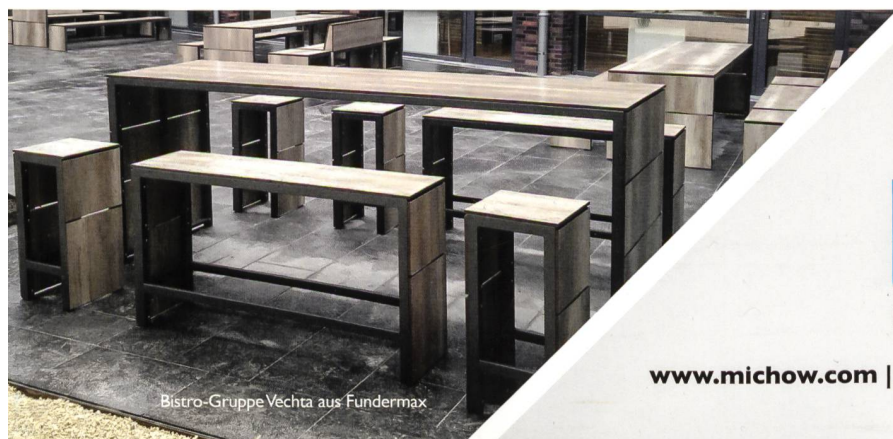
Bistro-Gruppe Vechta aus Fundermax

Bei der Gestaltung öffentlicher Räume und Parkanlagen setzen Sie mit ELANCIA immer auf den richtigen Partner. Denn mit uns an Ihrer Seite können Sie sich auf größtes Know-how von der Planung bis hin zur Realisierung verlassen. Schnell, präzise und aus einer Hand!