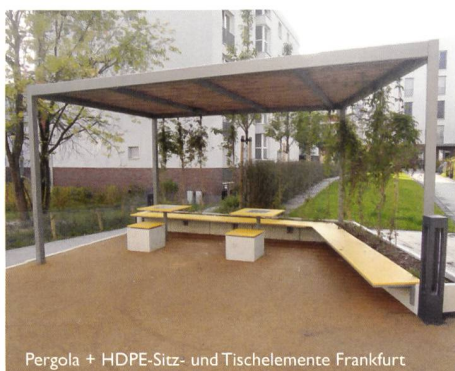
Pergola + HDPE-Sitz- und Tischelemente Frankfurt

Bei der Gestaltung öffentlicher Räume und Parkanlagen setzen Sie mit ELANCIA immer auf den richtigen Partner. Denn mit uns an Ihrer Seite können Sie sich auf größtes Know-how von der Planung bis hin zur Realisierung verlassen. Schnell, präzise und aus einer Hand!