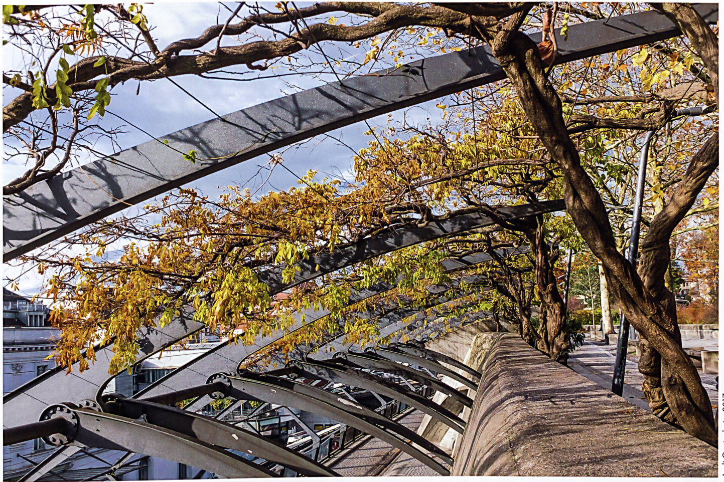
Andi Gantenbein, 2017

Pergolakonstruktion am Bahnhof Stadelhofen, Zürich (1982–1990). Construction d'une pergola à la gare de Stadelhofen, Zurich (1982–1990).