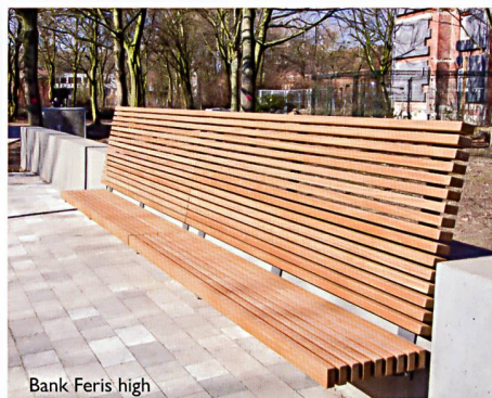
Bank Feris high

Bei der Gestaltung öffentlicher Räume und Parkanlagen setzen Sie mit ELANCIA immer auf den richtigen Partner. Denn mit uns an Ihrer Seite können Sie sich auf größtes Know-how von der Planung bis hin zur Realisierung verlassen. Schnell, präzise und aus einer Hand!