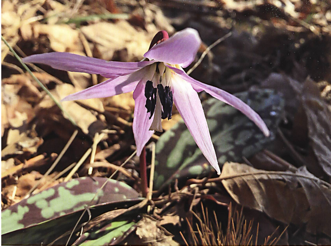
FotografIn & FinderIn Rita Illien (2)