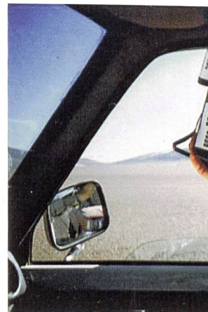
Einsatz eines GPS-Empfängers bei der Geländearbeit. Hochaden, 1993.