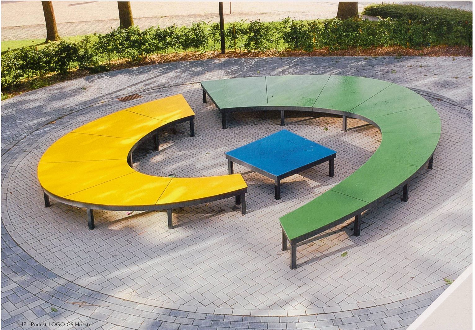
HPL-Podest-LOGO GS Hörstel

Intelligentes Stadtmobiliar: innovativ, kommunikativ, inspirierend