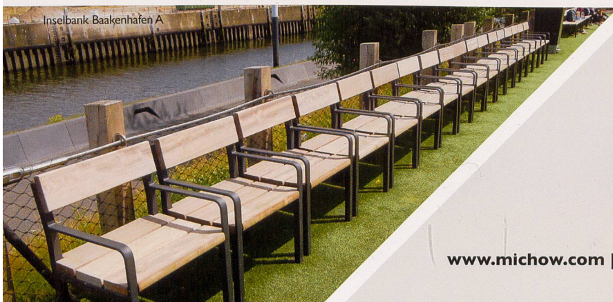
Inselbank Baakenhafen A

Bei der Gestaltung öffentlicher Räume und Parkanlagen setzen Sie mit ELANCIA immer auf den richtigen Partner. Denn mit uns an Ihrer Seite können Sie sich auf größtes Know-how von der Planung bis hin zur Realisierung verlassen. Schnell, präzise und aus einer Hand!