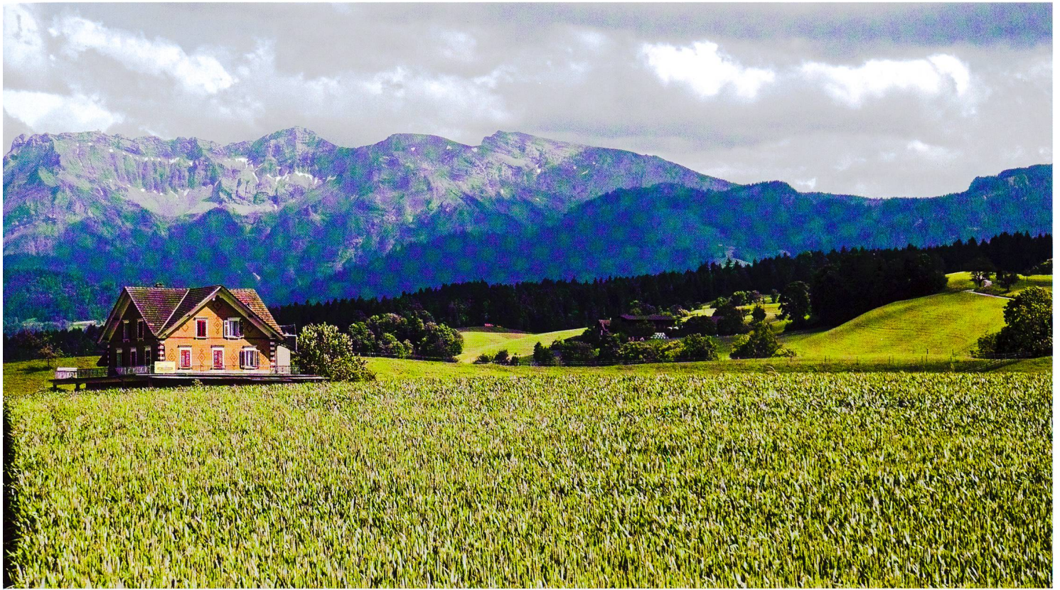
Reto Camenzind, ARE (3)