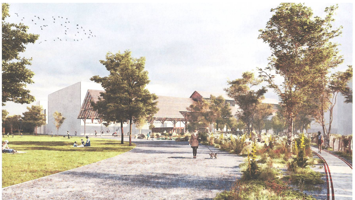
Tom Schmid Visualisierungen | Krebs und Herde Landschaftsarchitekten