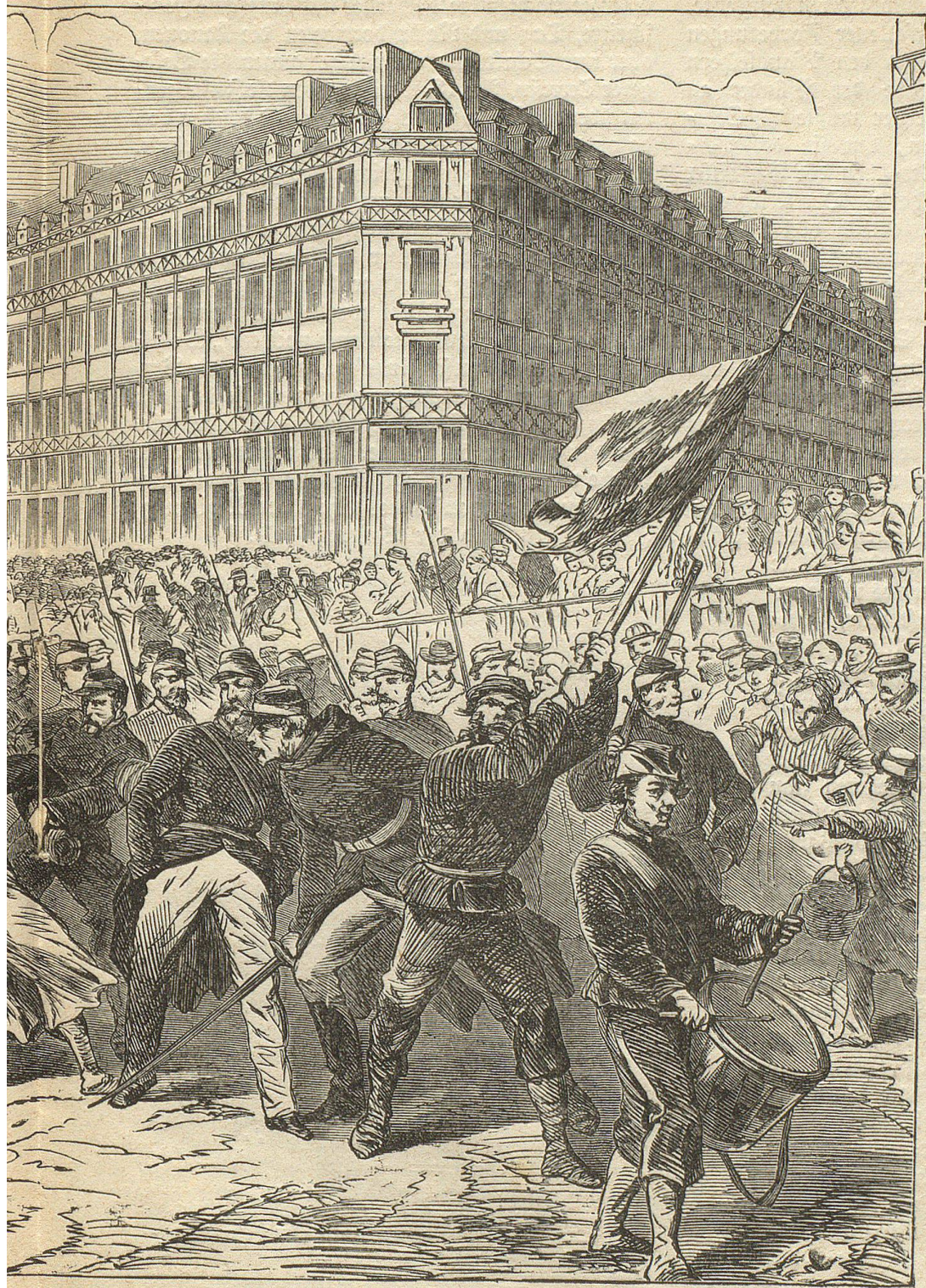
Arbeitslosen durch Überfluthung.

ges zur Wiederaufnahme der Arbeit nicht entschließen konnten.