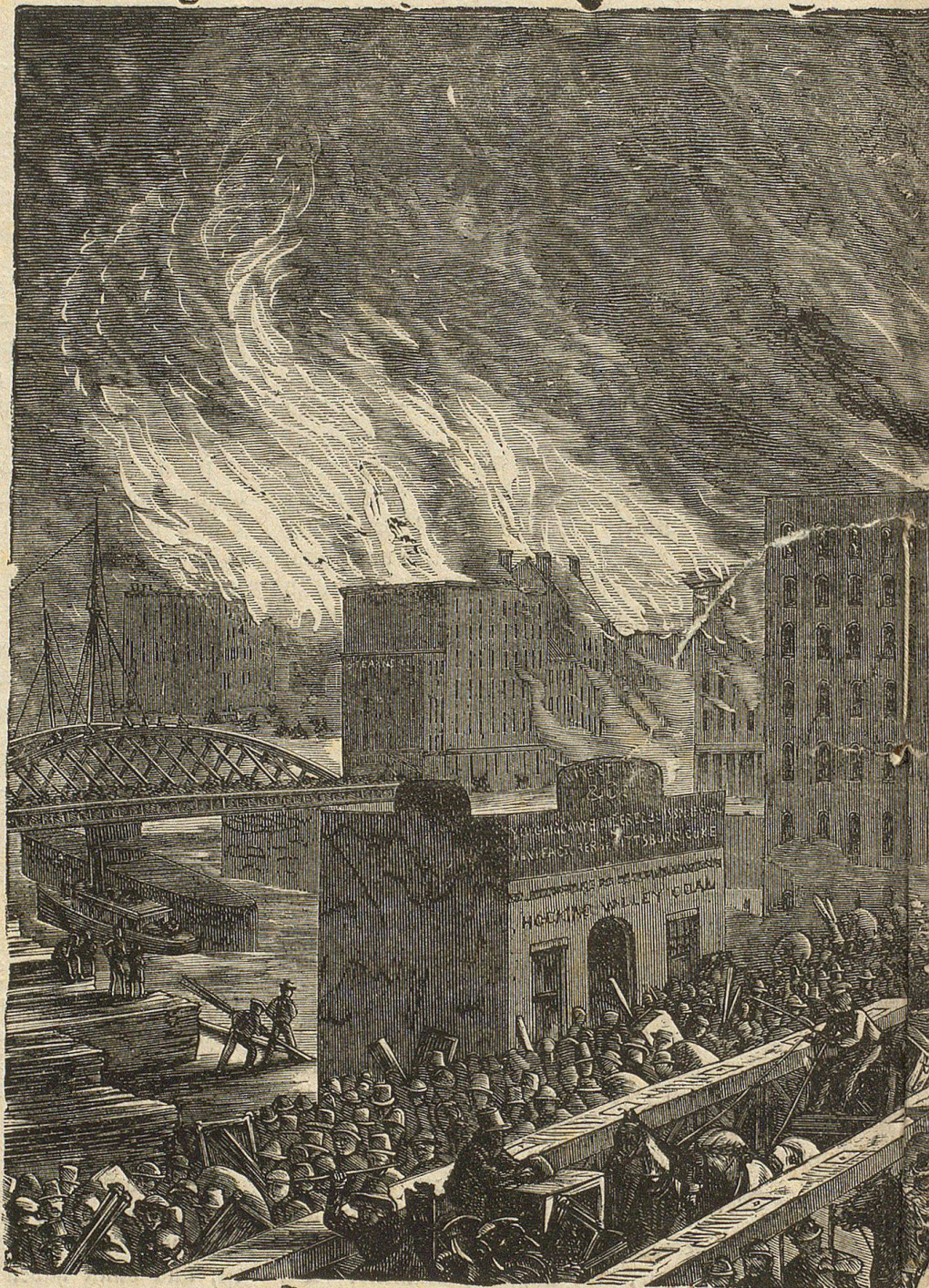
Flucht der vom Feuer vertriebenen Einwohner

In einer weiten Ebene am Gestade des Michigansees gerade da gelegen, wo der Chicagofluß sich in jenen ergießt, war es so schön angelegt, daß man es nur die „Garten-“ oder die „Musterstadt“ nannte. Vier verschiedene Eisenbahnlinien liefen hier zusammen und ein Duzend Dampfboote landeten täg-