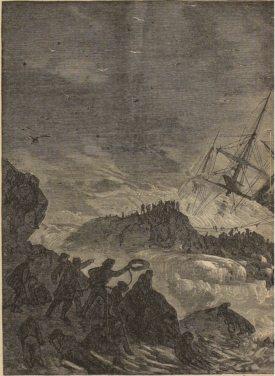
Der Untergang des „Atlas“