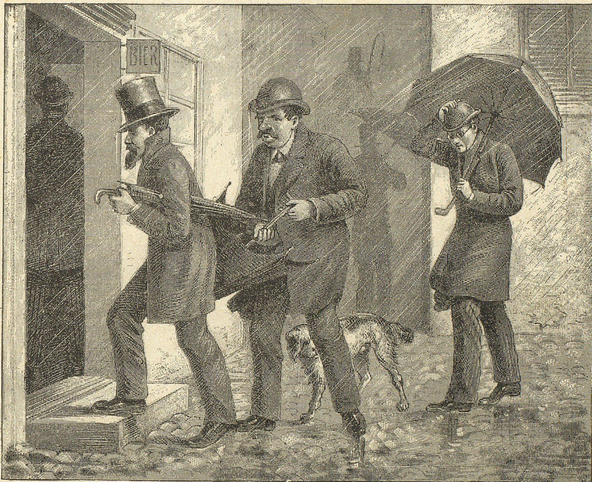
Abbildung z. 2. Akt, Szene 2 des „ Wilhelm Tell . Bürgerliches Schauspiel von Friedr. Schiller .“

Erster Eidgenosß: „Nicht unter Fürsten bogen wir das Knie!“