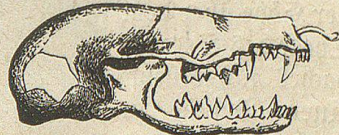
Schädel des Maulwurfs.

wegs befürwortet werden. Erst da, wo die gebieterische Nothwendigkeit es erheischt, schreite man gegen ihn ein; aber auch dann noch mit Schonung, Maaß und Ziel. Im Allgemeinen aber betrachte ihn der Landmann als seinen getreuen Verbündeten, der unablässig bemüht ist, gegen seine schlimmen unterirdischen Feinde zu Felde zu ziehen und der den kleinen Schaden, den er mitunter durch seine Wühlereien verursacht, durch anderweitigen mehrfachen Nutzen fast immer mehr als aufwiegt.