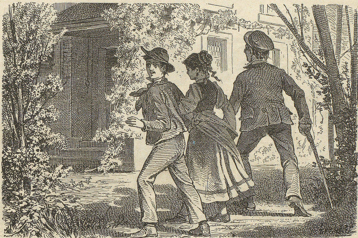
Also begaben sich die Dreie Samstag Abends auf dem Hinterweg nach dem Pfarrhause.

"Werd' es wohl thun müssen!" seufzte sie. "Ach, wie wird das neuerdings ein Gered' absehen und ein Gelächter im Dorf. Wenn's doch