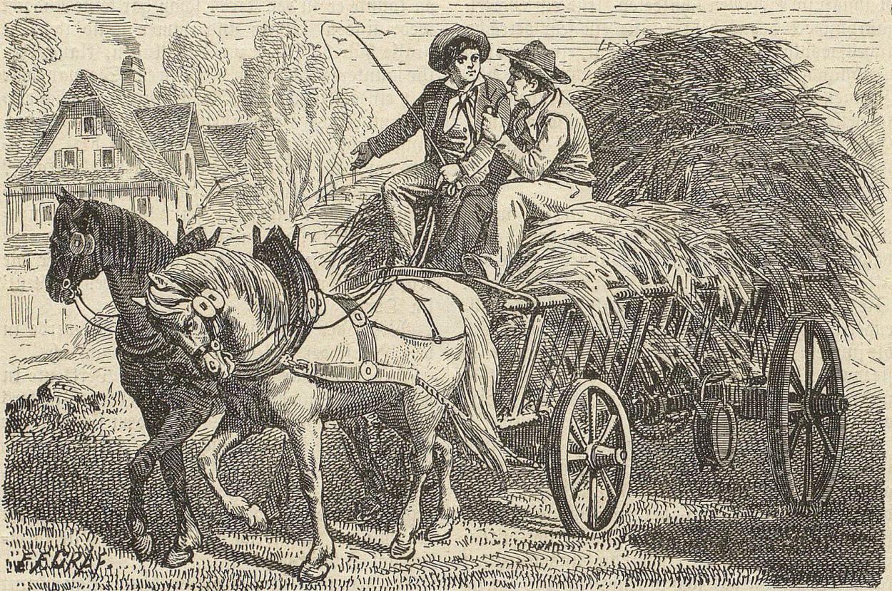
Die zwei Brüder saßen auf dem hochgefüllten Graswagen und fuhren mitsammen nach Hause.

„Ei ja, Du Einfalt! Sie hat nun des Karli's Vermögen geerbt — — Das gäb eine Lücke in unser Haus, wenn die fortginge mit ihrem Theil